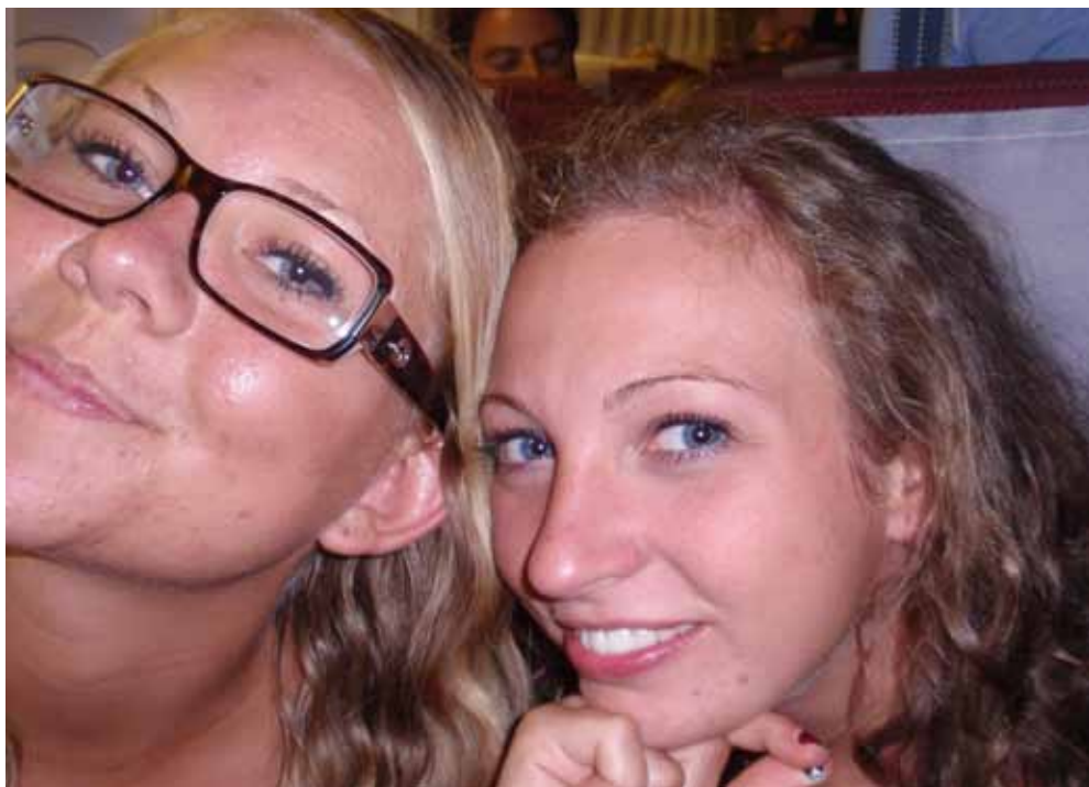
To trætte, men glade piger på vej hjem til Danmark.